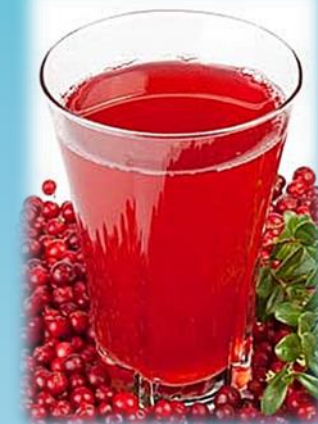
Морс из ягод