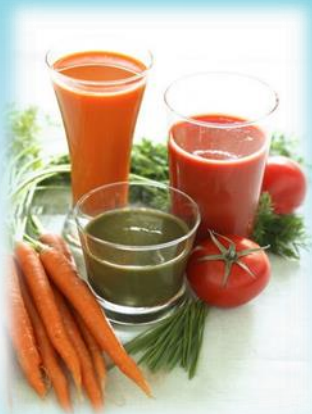
Натуральные соки фруктов и овощей